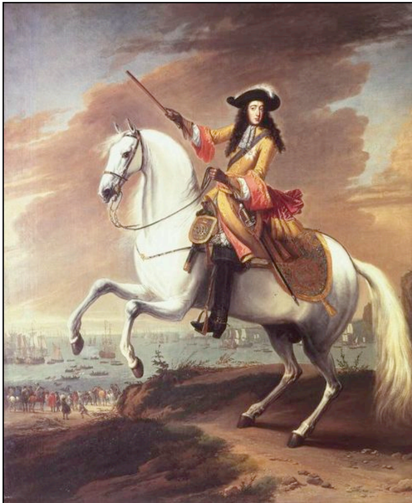
Guillaume III débarque à Brixham, peinture de Jan Wyck vers 1688.